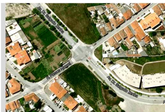
Intervenção na Rua Passos Manuel em Guifões